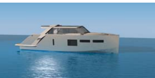
Der gerade Bug, das „Axe Bow Concept“, verleiht der „Magellan Space“ ein dynamisches Design mit enormem Raumgewinn in den Kabinen.